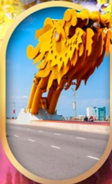
สะพานมังกรดานัง