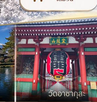
วัดวาคายากุสะ