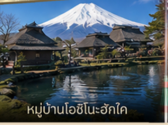
หมู่บ้านโอชิโนะอ๊กโค