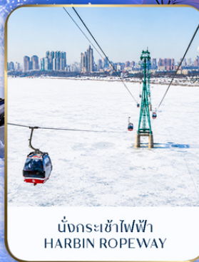
นั่งกระเช้าไฟฟ้า HARBIN ROPEWAY