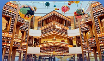
ต๋องสมุดสตาร์ฟิค