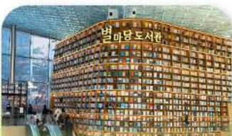
ห้องสมุดสตาร์ฟิช

เก็บทุกไฮไลท์ ในกรุงโซล ตั้งแต่ความงดงามของ พระราชวังเคียงบ็อก ชมวิวสุดอลังการที่ ตึกลิออตเต้ โซลสกาย (รวมค่าลิฟต์ขึ้นตึก) สวนสนุกมินีสที่ สวนสนุกลือตเต้ เวิร์ล (รวมค่าบัตรเครื่องเล่น) เพลิดเพลินไปกับโลกใต้ทะเล ลีออตเต้ อควาเรียม (รวมค่าบัตรเข้าชม) เช็กอินแลนด์มาร์กสุดฮิตอย่างห้องสมุดสตาร์ฟิช โคเอกมอลล์ เดินเล่นย่านฮิป บรูกลินเกาหลี ชองชูดง และช้อปปิ้งซัมเมอร์เซล สูดฟิน ย่านเมียงดงและฮงแด