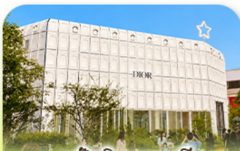
บรักลิเนาทาห์ลี