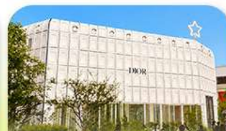
บรูกลินเกาหลี