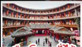
เมืองโบราณลั่วใต้