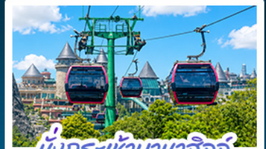
นั่งกระเช้าบานาฮิลล์