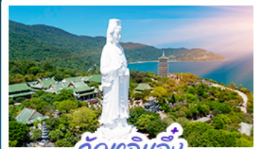
วัดเจลินเอ็ง