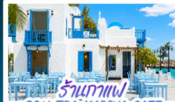
ร้านกาแฟ SON TRA MARINA CAFE