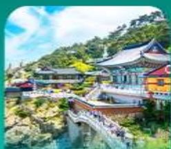
วัดแฮดงกุงกุงซา

เที่ยวปูซานแบบแกรนด์ แกรนด์ ทั้งสายอาร์ท สายบู และสายช้อปปิ้ง • เขิกจันบนท่าอูร์นสุดคูลเลอร์ฟูล ที่ท่าเรือจินบี (BUSAN BUNEZIA) เติบสันหมู่บ้านคิมชอน ซาซโดริมแห่งปูซานสุดน่ารัก พลาดไม่ได้กับการนั่งรถไฟปูกัน ขบวนทะเลเมืองปูซาน • เสริมสิริมงคลที่วัดแฮดงกุงซา วัดริมทะเลชื่อดัง พร้อมช้อปปิ้งที่ลือชื่อเตพร็อนย็อนเจ้ากิล และตลาดบันโพดง ก่อนปิดท้ายด้วย ย่านวีอูร์นสุดชิค ซอ มยอง ออว็อน พร้อมชมวิวสะพาน ควังอินยามค่าขึ้นสุดโรแมนติก