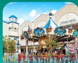
ลิวตเต้ ไอท์เกิ้ล