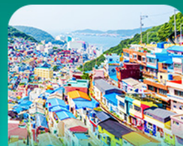
หมู่บ้านแดมเชอน