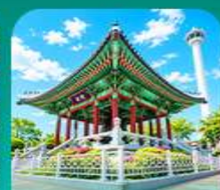
สวนเข่งดูซาน