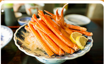
พิเศษ! ชาปู