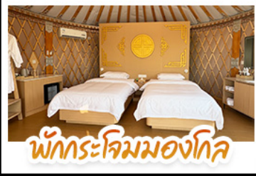
พักกระโจมมองไกล

เที่ยวสบาย นอนหรูระดับ 5 ดาว เปลี่ยนลูกเป็นสาวมองไกลสุดซึ้ง! ทริปนี้จัดให้แบบ V.I.P. เปิดประสบการณ์ พักกระโจมมองไกลสุดพรีเมียม พร้อมนั่งกระเช้าและขี่อูฐไปตะลุยเนินทรายสีงาชวาน เก็บครบทั้งไฮโซดและสุสานเจงกิสข่าน