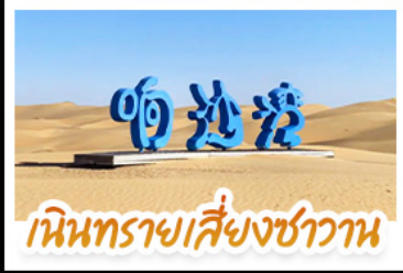
เนินทรายสีงาชวาน