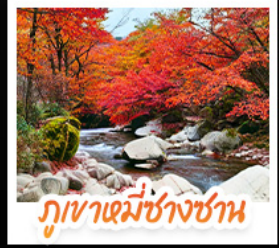
ภูเขาเดมิซางซาน