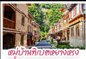
หมู่บ้านทิบตหยางหงซา

ตะลุยเจ็ดตุ๋น ต้ากู่ปิงชาน ชวนเซ็กคินแพนด้ายักษ์ พักใจที่หยดน้ำดาสีฟ้า! แวะชมเมืองโบราณลั่วโถ่ สัมผัสมนต์เสน่ห์ หมู่บ้านทิบตหยางหงซาต่อ สัมผัสความหนาวเย็นที่ อู๋ชานสวรรค์ธารน้ำแข็งต้ากู่ปิงชาน แหล่งรวมวิวหลักล้าน ตื่นตาไปกับแสงสียามค่ำคืน หยดน้ำดาสีฟ้า ณ สะพานหนานเฉียว เมืองตุ๋นเจียงเจียงน ก่อนปิดท้ายด้วยการช้อปปิ้งจุใจ ถนนชุนซีลู่-ไท่กู่หลี่ และเซะภาพกับ แพนด้าเซลฟี สุดคิวท์