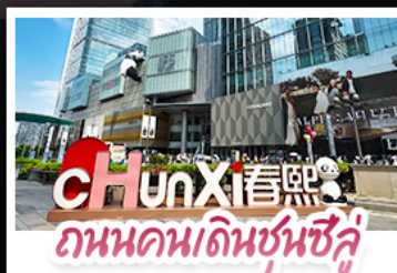
ถนนชุนซีลู่-ไท่กู่หลี่