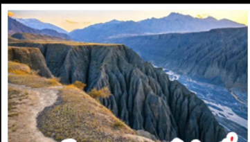
แกรนด์แคนยอนตุ่ซานจื่อ

ทะเลสาบโซหลิมู - คานาสี แกรนด์แคนยอนตุ่ซานจื่อ ตลาดแกรนด์บาซาร์ - หมู่บ้านเหม่อ