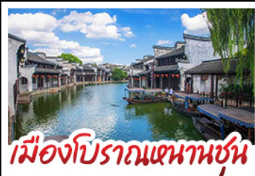
เมืองโบราณหนานชุน

DISNEYLAND SHANGHAI เต็มวัน เมืองโบราณหนานชุน (รวมล่องเรือ) - วัดจิ่งอัน เมืองโบราณหนานชุน - ตลาดร้อยปีฉิงหวังเมี่ยว มือพิเศษ บุฟเฟ่ต์ BBQ, เสี่ยวหลงเปา