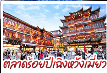
ตลาดร้อยปีฉิงหวังเมี่ยว