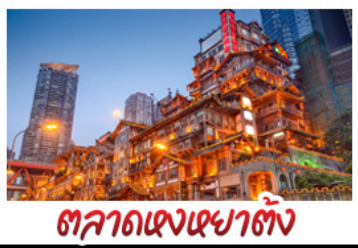
ตลาดแดงเซาตัง