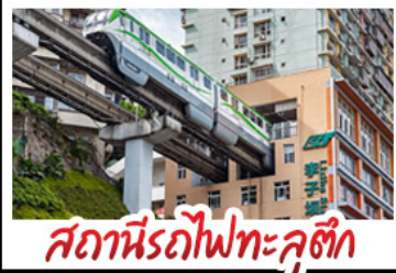
สถานีรถไฟทะเลคุตึก