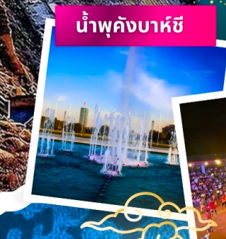
น้ำพุคังบาศี