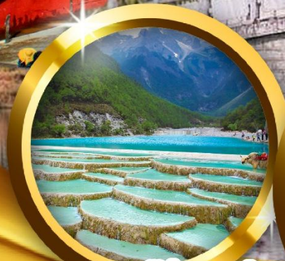
ทะเลสาบใสสุดเห่อ