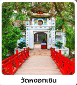
วัดหงอกเซิน