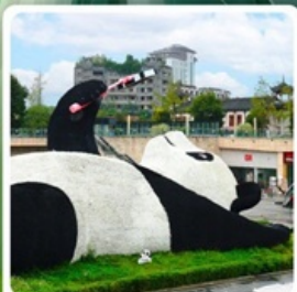
รูปปั้นหมีแพนด้าอนเซลฟี