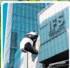
แพนด้ายักษ์ป็นตึก IFS