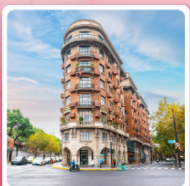
ถนนอู๋คัง