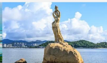
จูไห่ฟิชเชอร์เกิร์ล(หวีหนี่)

*ทางบริษัทฯ ขอสงวนสิทธิ์ในการสลับโปรแกรมทัวร์ตามความเหมาะสมขึ้นอยู่กับสถานการณ์หน้างาน โดยคำนึงถึงผลประโยชน์ของลูกค้าเป็นสำคัญ