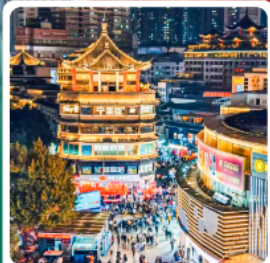
ตลาดตงเหมิน

• โฮเทล OH Bay เป็นแลนด์มาร์คท่องเที่ยวและศูนย์การค้าทันสมัยมีทะเล กวนอูในเซินเจิ้น ขึ้นชื่อเรื่องการช้อปปิ้ง โชคกลาง บาร์มี ความสำเร็จในการทำงาน