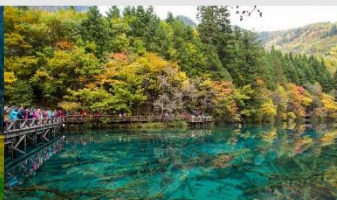
อุทยานแห่งชาติจี๊จ้ายโกว