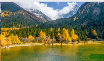
อุทยานแห่งชาติปี้เผิงโกว