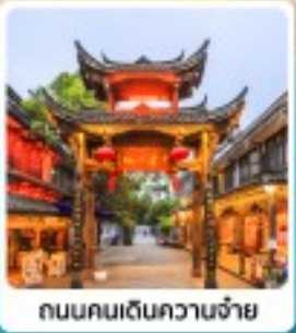
ถนนคนเดินควานจ้าย

• ไอลี่ หุบเขาของเจียวโกว สวรรค์บนดิน ณ ภูเขาสิดรุณี วัดต้าเจี๋ย วัดหามณฑล ใจกลางนครเจิงตู