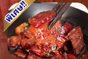
เมนูหมูสามชั้นตุ๋นน้ำแดง

พักโรงแรม 4 ดาว ★★★★★ ฟรี ประกันอุบัติเหตุ บริการ อาหารท้องถิ่น