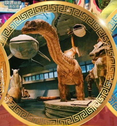
พิพิธภัณฑ์ธรรมชาติเซี่ยงไฮ้