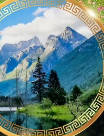
หุบเขาหวงเฉียวโกว