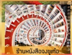
ร้านหนังสือจุกเท่อ