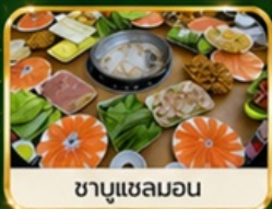
ชาบูแชลมอน