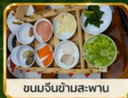
ขนมจีนข้ามสะพาน