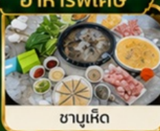
ชาบูเห็ด