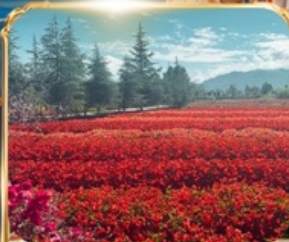
สวนดอกไม้ HUA YU MU CHANG