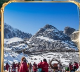
ภูเขาหิมะมังกรหยก +กระเช้าใหญ่