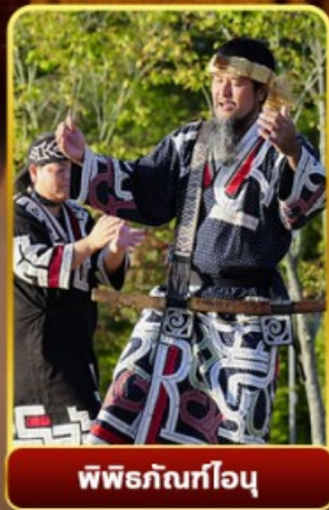
พิพิธภัณฑ์โอคุ