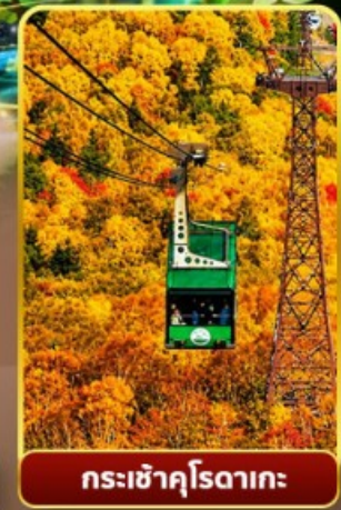
กระเช้าคุโรดากะ