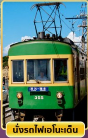
นั่งรถไฟเอโนะเด็ง