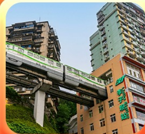
“นั่งรถไฟทะลุตึก”