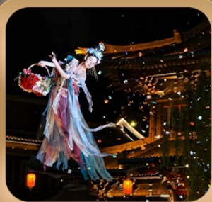
“เมืองโบราณลั่วอี้”

ชมถ้ำหลงเหมิน มรดกโลกที่เมืองลั่วหยาง • สุสานจีนซีฮ่องเต้ • ศาลเจ้ากวนอู วัดเส้าหลิน + ป่าเจดีย์ + ชมโชว์กังฟู • เมืองโบราณลั่วอี้ • อุทยานหุ่นไม้ชาน เจดีย์ห่านป่าใหญ่ • ถนนวัฒนธรรมต้าถิง • ถนนคนเดินอิสลาม • จัตุรัสหอรบะซิง