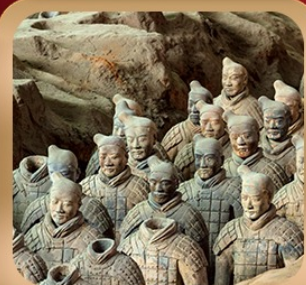
“สุสานจีนซีฮ่องเต้”