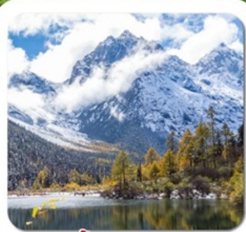
"ปี้เผิงโกว"

ชมความงาม 2 อุทยาน • สี่ดรุณี ของเฉียวโกว + ปี้เผิงโกว • พระใหญ่เล่อซาน สะพานหนานเฉียว น้ำตาสีฟ้า • ห้างสรรพสินค้า จงซูเก๋อ • แพนด้ายักษ์บนอนเซลฟ์ ชอยกว้างชอยแคบ • ถนนคนเดินชุนซีลู่ • แพนด้ายักษ์ปิ่นตึก • ถนนคนเดินจินหลี่