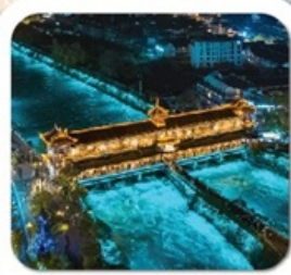
"สะพานหนานเฉียว"