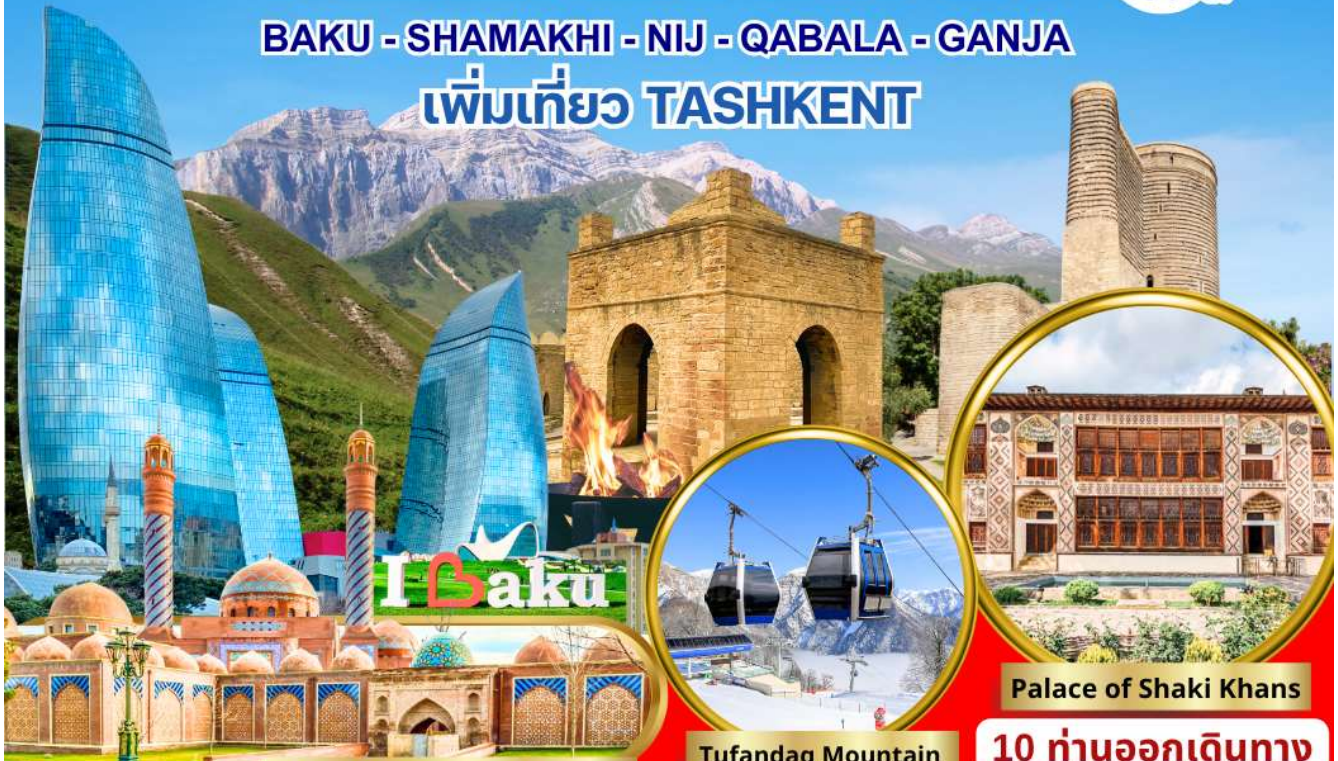
Masjed Imamzadeh Ibrahim