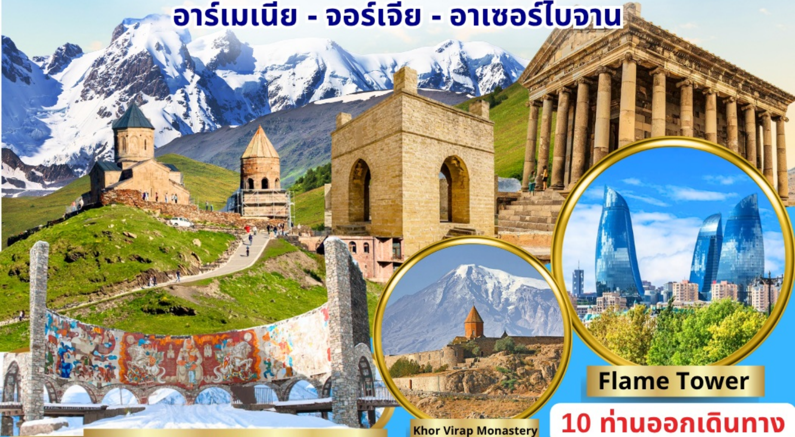
Georgian-Russian Friendship Monument