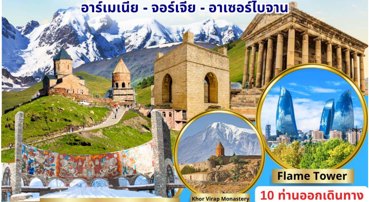
Georgian-Russian Friendship Monument