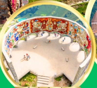
Russian-Georgian Friendship Monument