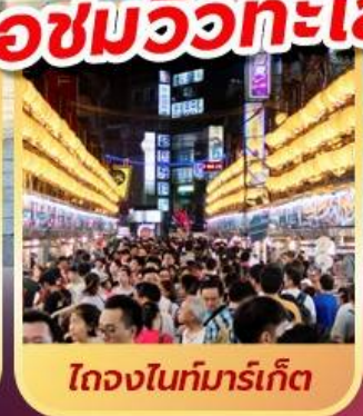
ไถจงไนท์มาร์เก็ต