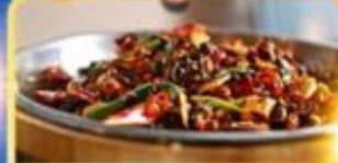
อาหารเสฉวน