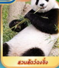
สวนสัตว์จงชิ่ง