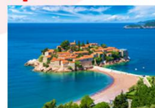
หมู่บ้านสเวติ สเตฟาน