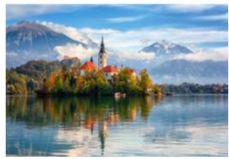
ทะเลสาบเบลด

05.15 น. เดินทางถึงสนามบินอิสตันบูล และเปลี่ยนเครื่อง 07.15 น. ออกเดินทางสู่เมืองลูบลยานา ประเทศสโลวีเนีย เที่ยวบิน TK1061 08.30 น. เดินทางถึงสนามบินลูบลยานา โจเซ ฟุซนิค