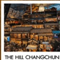
THE HILL CHANGCHUN