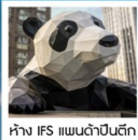
ห้าง IFS แพนด้าป็นตัก