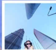
3 ตึกใหญ่แห่งเมืองเชียงใหม่