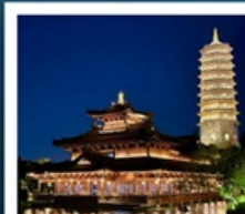
เมืองโบราณฝูหยวน

เมืองโบราณฝูหยวน / ภูเขาหินัวสั่วชาน (รวมรถกอล์ฟ) ห้างสรรพสินค้าเต๋อจี / วัดจีหมิง / ทะเลสาบเซวียนอู่ ถนนอู่กงต้าเต้า / อู๋ซีหมู่บ้านเหียนฮาวาน / เขาคูซิว เชียงใหม่ คลาสสิก ไท่ / ถนนนานกิง / Tian An 1,000 Trees North Bund Green Land / Florentia Village Outlet