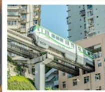
รถไฟฟ้าทะเลคุตัก