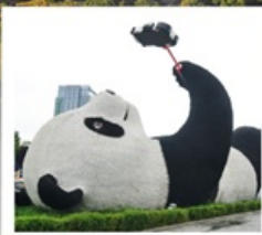
รูปปั้นแพนด้าเซลพี่