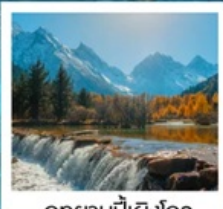
อุทยานπίงผิงโกว