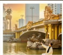
ย่านอิตาลี