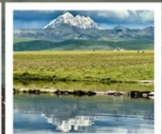
ดวงตาแห่งต่ำถาง