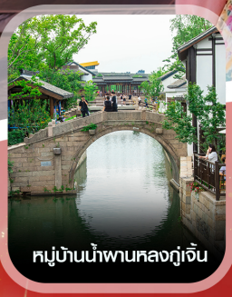
หมู่บ้านน้ำผานหลงกู่เจิน